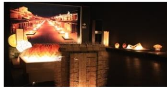
• Bảo tàng đèn lồng từ giấy Nhật Mino