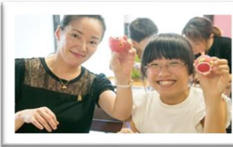
• Tự làm thủ công từ giấy Nhật Mino