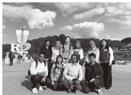
Tham quan công viên hoa hồng Gifu World