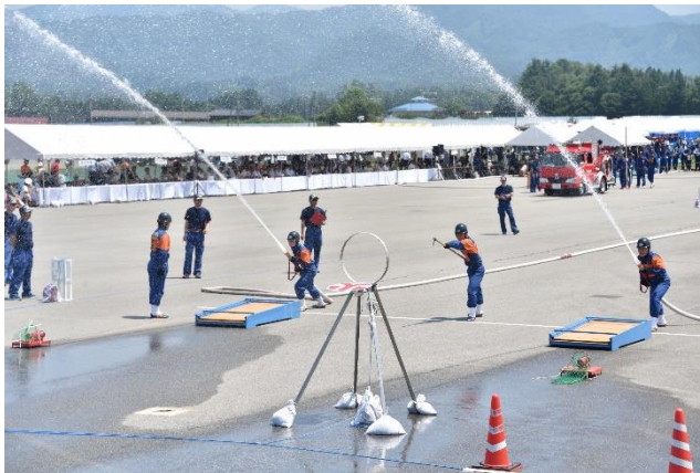
Đại hội thao tác phòng cháy của tỉnh năm niên hiệu Lệnh Hòa đầu tiên

Bạn có muốn cùng tham gia đội cứu hỏa khu vực không?