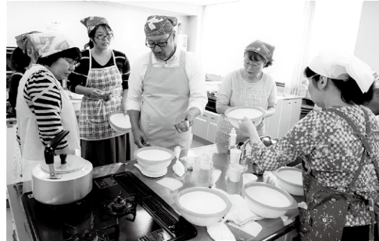
りょうり たいけん 料理体験