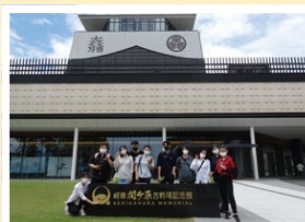
記念館前で集合写真