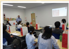
熱心に耳を傾ける留学生

企業訪問が初めての学生も少なくなく、最初は緊張していた様子でしたが、積極的に質問や感想を述べ、企業との交流を図ることができました。