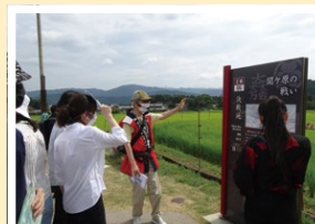
関ヶ原の戦いの決戦地

戦国時代の歴史を学びながら、岐阜・関ヶ原の魅力を感じてもらおうよい機会となりました。