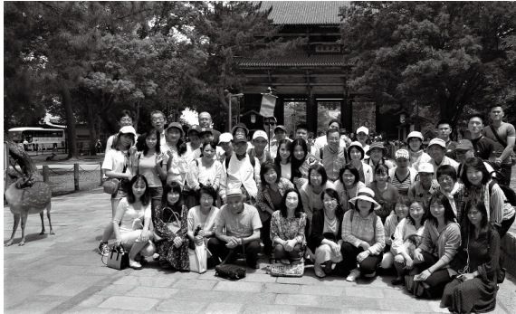
れきし たんぼう 歴史探訪

これまでの民間主体の継続的な国際交流活動に対して、昨年11月養老町自治功労者表彰、今年5月岐阜県各界功労者表彰を拝受しました。養老から世界の人々と繋がれることを喜びとして、今後も多文化共生の研修を重ね、貴重な学びや嬉しい出会いのある活動を楽しんでいきたいと思ひます。