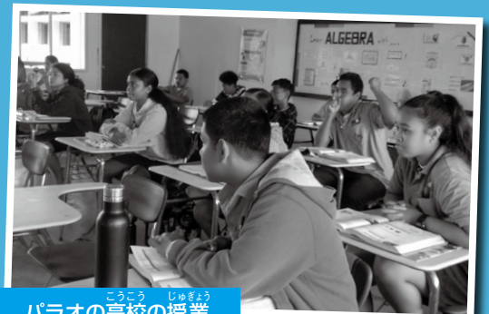
パラオの高校の授業

私は太平洋に浮かぶ小さな島、グアムやサイパンにも近いパラオ共和国で活動してきました。パラオでは数学を教えることができる先生が少ないので、JICAから日本の先生が小学校に派遣されています。私はパラオの先生に数学を教えたり、教え方のアドバイスをしたり、時には学生に教えたりしました。数学は毎日90分授業で、学生は真剣に勉強し、質問もよくします。私が問題の解き方を教えると、必ず「ありがとう」と言うのが印象的でした。先生も数学を勉強しています。6月からの夏休み1週間前は、スポーツ大会やBBQパーティなどイベントが沢山あり、私も参加してパラオの人々とすばらしい交流ができました。