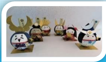
・美濃和紙雑貨作り体験