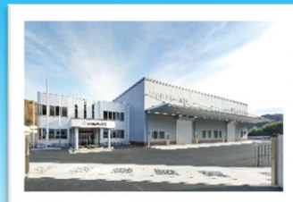
株式会社キョウワ