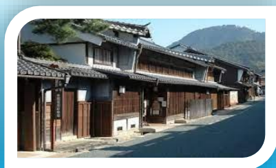
・うだつのあがる町並み