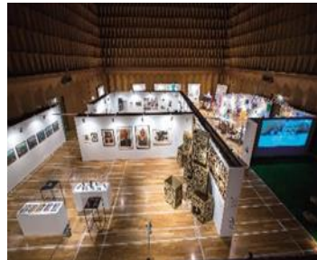
Eksibisyon noong nakaraang taon