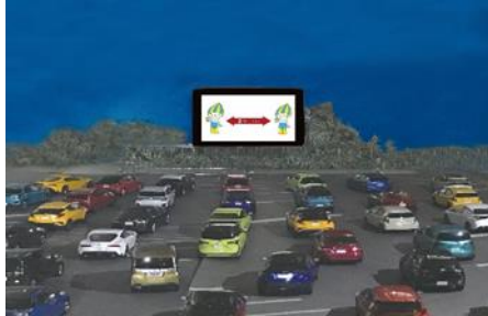
Kaliwa: Yoro Park 140 Anniversary Logo Kanan: Drive-in theater (Image)

Sa pagdiriwang ng ika-140 anibersaryo ng Yoro Park, gaganapin ang iba't ibang mga kaganapan tulad ng projection mapping, decentralized stage, drive-in theatre, open café, at iba pa na mai-enjoy sa Autumn weekends na naayon sa COVID countermeasures.