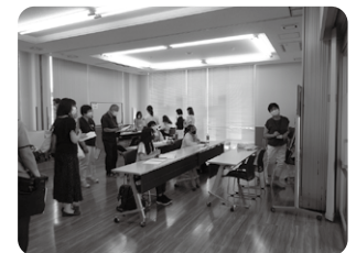
Pagbisita sa silid-aralan