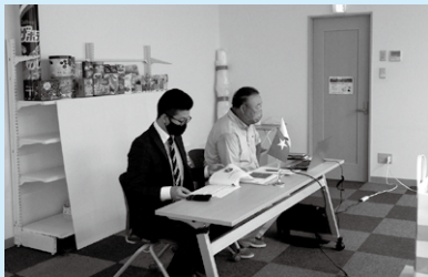
Paliwanag mula sa kinatawan ng kompanya