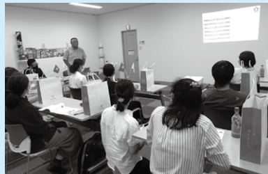
Nakikinig na Mabuti ang mga international students

Karamihan sa mga estudyante ay hindi pa nakaranas bumisita sa mga kompanya kaya medyo kinakabahan, ngunit aktibo silang nagtanong at nagpahayag ng kanilang mga saloobin at maayos na nakipag-halubilo sa kompanyang binisita.