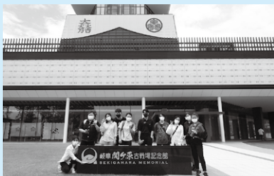
Litrato ng grupo sa harapan ng museo