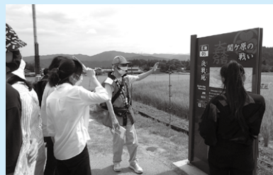
Lugar ng labanan sa Sekigahara

Ang tour ay naging isang magandang pagkakataon upang matutunan ang tungkol sa kasaysayan ng panahon ng Sengoku at madama ang kagandahan ng Gifu at Sekigahara.