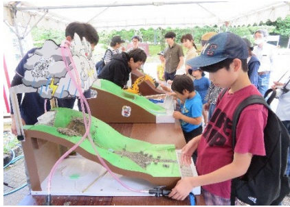
Sabo Fair noong nakaraang taon

Isasagawa ang "Landslide (Sabo) Prevention Month" sa Hunyo dahil ito ang panahon ng tag-ulan at dito tumataas ang panganib sa pagguho ng lupa.