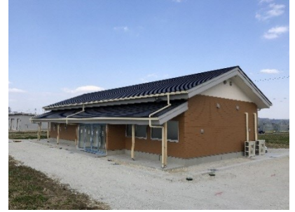
Smart Agriculture Promotion Base Operation Center

Ang prefecture ay nagtaguyod ng "Smart Agriculture" upang higit pang mapabuti ang produksyon at kakayahang kumita ng agrikultura sa Gifu.