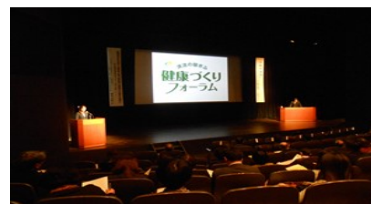
Larawan ng Health Promotion Forum noong nakaraang taon