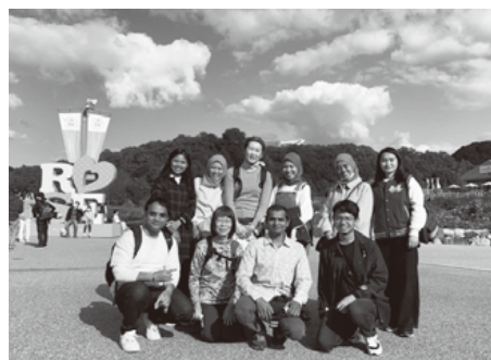
Ginawang pagbisita sa Gifu World Rose Garden