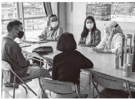
Kung may kahilingan, meron ding mga group talk at online lessons