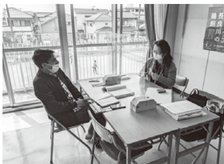
Isang tagpo habang nag-aaral