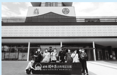
Foto comemorativa em frente ao museu