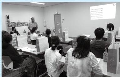
Intercambistas ouvindo com atenção

Muitos estudantes demonstravam insegurança porque visitaram uma empresa pela primeira vez, mas conseguiram interagir positivamente com seus comentários e suas perguntas.