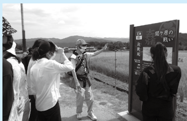
Local do confronto final da Batalha de Sekigahara

Foi uma ótima oportunidade para se fascinar por Gifu e Sekigahara, aprendendo sobre a história do Período Sengoku. Curso visitado: 1- Último acampamento das tropas de Tokugawa Ieyasu; 2- Local do confronto final; 3- Local das tropas de Ishida Mitsunari.