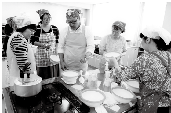
Aula de culinária