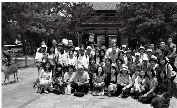
Passeio de investigação da história

O trabalho contínuo de pessoas civis atuantes no intercâmbio internacional até o presente levou ao recebimento do prêmio de contribuição à cidade por Yoro, em novembro do ano passado, e à província por Gifu, em maio deste ano. A associação sente-se feliz em ligar Yoro e os povos do mundo e deseja no futuro desfrutar dos estudos valiosos e encontros alegres ao realizar os numerosos treinamentos sobre coexistência multicultural.