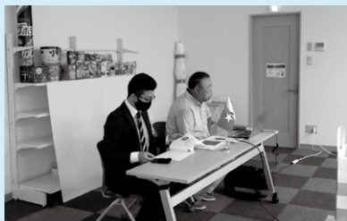
Explicação pelos responsáveis da empresa