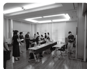
Observação de aula