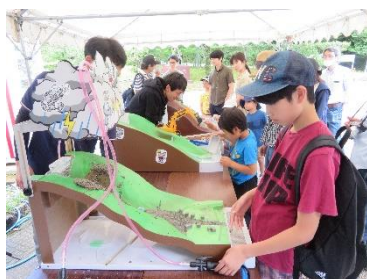
Imagens do festival do ano passado

No mês de junho, inicia-se a estação das chuvas ( tsuyu ) e as chuvas aumentam elevando o risco de ocorrer deslizamentos de terra, portanto, o mês