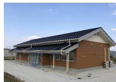
Centro Base de Operações para a Promoção da Agricultura Inteligente

A província de Gifu promove a promoção da Agricultura Inteligente (Smart Agriculture) com o propósito de buscar melhorias na produção