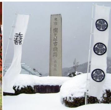
Campo da batalha de Sekigahara (inverno)

Será realizado um concurso de fotografia de Sekigahara, que tem o objetivo de difundir os atrativos de “Sekigahara – o palco da divisão do reino” para todo o país. Qualquer pessoa poderá participar, seja fotógrafos amadores ou profissionais.