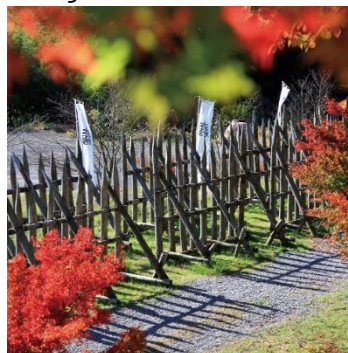
Campo da batalha de Sekigahara (outono)