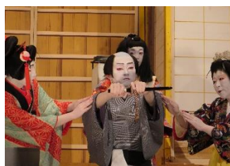
Iiji Gomouza Kabuki Hozonkai

Será realizado o espetáculo de Jikabuki dos grupos Kushihara Kabuki Hozonkai e do Iiji Gomouza Kabuki Hozonkai (ambos da cidade de Ena) e o espetáculo do regresso triunfal dos grupos Kashimo Kabuki Hozonkai (Nakatsugawa-shi) e do Houou Kabuki Hozonkai (Gero-shi) que estiveram nos palcos da França e da Espanha em outubro deste ano. Haverá ainda a promoção dos pontos turísticos e a venda de produtos exclusivos das cidades origem dos grupos que irão se apresentar, portanto, não percam!