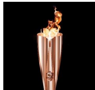
Tocha olímpica do revezamento

Durante 2 dias, 164 condutores da tocha que têm alguma ligação com esta província, estarão participando do revezamento da tocha em 11 cidades da província. Em cada ponto de partida e de chegada nas cidades haverá realização de cerimônias. No dia, solicitamos uma calorosa torcida para os condutores da tocha no local dos eventos e nas ruas por onde a tocha passará.