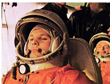
Yuri Gagarin

Será realizado um evento em comemoração aos 2 anos de inauguração do Museu Sorahaku. O evento conta com a exposição de painel