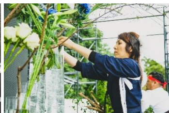
Competição de Ikebana

Será realizado um evento com a temática da Batalha de Sekigahara e o confronto leste oeste. Haverá show no palco reproduzindo a Batalha de Sekigahara; “Competição de Ikebana” na qual os praticantes arrancam as flores de forma improvisada e disputam as belezas; e competição leste-oeste dos restaurantes famosos de macarrão localizados na região leste e oeste do Japão.