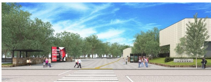
Portal de entrada sul reformada (ilustração)

O Museu de Belas Artes de Gifu renascerá como um “Museu acessível” para que todos possam utilizá-lo de forma confortável através da implantação de estacionamentos acessíveis e sala de apoio à amamentação. No dia da reabertura será realizado um evento comemorativo e o “Festival de outono Seiryu no Kuni Gifu Bunka no Mori ” na rua (fechada exclusivamente para o evento) localizada entre o Museu e a Biblioteca da Província de Gifu.