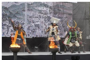
Show no palco reproduz a Batalha de Sekigahara