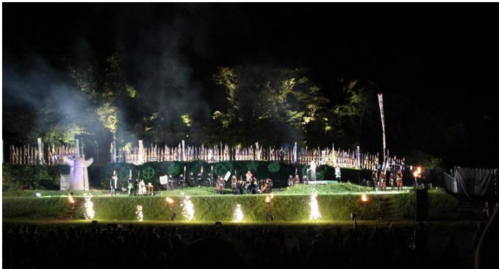
Imagens do Sekigahara Night 2018