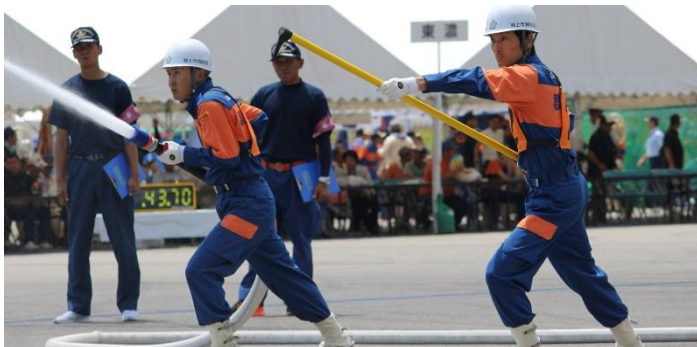
Imagens do evento realizado em 2018

É um evento de competição das práticas operacionais dos bombeiros como uma forma de mostrar os resultados obtidos nos treinamentos diários dos bombeiros voluntários (shobodan-in) que garantem a segurança e a tranquilidade do bairro .