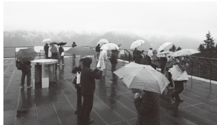
▲ Teleférico Shinhotaka

No primeiro dia foram iniciadas as atividades de “forja de espadas japonesas” na cidade de Seki, “visita a rua tradicional” e “confecção de papéis tradicionais japoneses ao estilo Mino” da cidade de Mino. Todos os participantes vivenciaram as tradições de Gifu através das marteladas dadas no aço ardente que forjam as lâminas, e da confecção de papéis japoneses exclusivos.