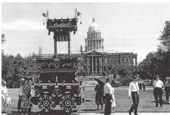
1964/Cidade de Denver