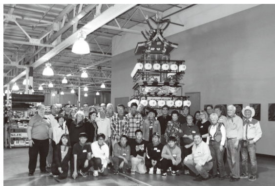
2019/Restauração da carruagem “Kizunatai”