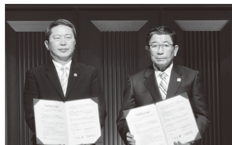
▲ Memorando entre a Província de Gifu e a Associação Provincial Internacional relativa cooperação na expansão de produtos locais ao exterior.

No dia 30 foram realizadas exposições e venda de produtos locais, junto da apresentação de afiliações das associações provinciais. Os eventos de confraternização proporcionaram grande entretenimento através dos “Workshops culturais de Gifu”, e o “Concurso de Apresentações para Apoio de Jovens Intercâmbistas”.