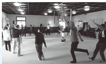
◀ Atividade de “Dança tradicional de Gujo”

No terceiro dia, todos realizaram a “dança tradicional de Gujo”. A maioria dos participantes da associação provincial eram brasileiros, dos quais interagiram com seriedade e alegria devido à proximidade com vários tipos de danças.