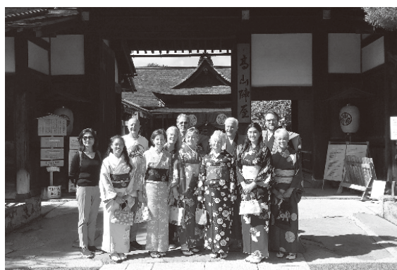
Grupo visitante de Denver (Tradicional quartel administrativo de Takayama “Takayama Jinya”)