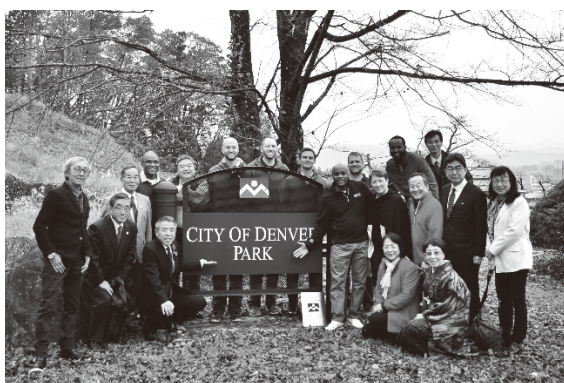
Colina da amizade (Cidade de Takayama)