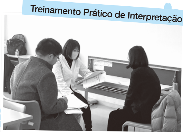
Treinamento Prático de Interpretação

A maioria dos participantes já tinha experiência em interpretação médica para familiares ou conhecidos. Mesmo assim, recebemos um ótimo feedback dos participantes, como: "Aprendi que é importante confirmar diretamente com o médico caso encontre termos técnicos desconhecidos ou tenha dúvidas durante a interpretação" e "Percebi que minha interpretação era baseada apenas no meu próprio método". O treinamento proporcionou uma oportunidade valiosa para aprender diferentes abordagens através da prática, levando a novas descobertas e aprimoramento das habilidades.