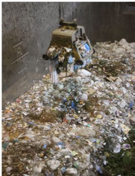
F 3: Depósito de lixo do Clean Center Municipal

O 'lixo' é gerado diariamente na nossa vida cotidiana. No entanto, ele está causando grave problema, pela sua influência ecológica. Sua queima causa o aquecimento da Terra, com a emissão do dióxido de carbono. Tanto a poluição da água como a do solo também são problemas consequentes dele.