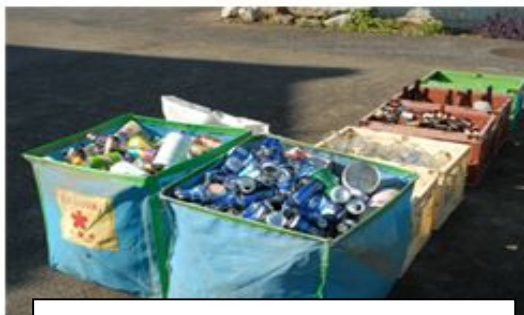
F 1: Lixos recicláveis sendo classificados