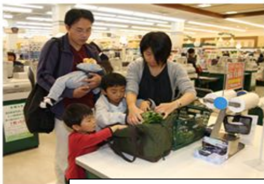
F 2: Levando sacola para compras