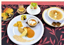
※昨年の料理写真です

■期間/9月5日(月)～9月9日(金) ■時間/11:00～14:00 ■場所/岐阜商工会議所1階レストラン 「オリビエ」(岐阜市神田町2-2) ■定員/1日30食限定