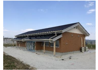
智慧农业推进基地操作中心

为了提高岐阜县内农业的生产和收益，切实推行智慧农业。智慧农业基地设置在海津市，即将开业。农民和有意愿就农人员，在此基地可以体验操作拖拉机机器人和无人机等智慧农业的设备，利用ICT技术栽培西红柿的示范实验和信息发布等。