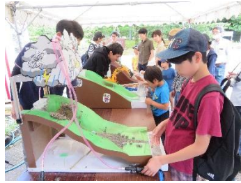
去年砂防展示会活动的情景

因6月梅雨季节降雨较多，发生泥石流灾害的危险性也随之升高，所以将6月份定为“泥石流灾害预防月”。