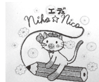
吉祥物角色 二コちゃん

我们希望根源于海外的孩子们、在「二ホ」(日本)、带着「二コ」(笑容)、笑着生活。