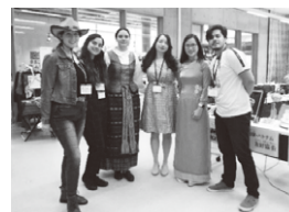
▲岐阜县国际交流员