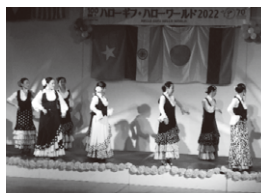
▲岐阜西班牙文化中心 吉普赛舞表演