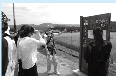
关原之战的决战地