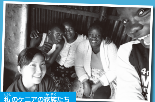
私のケニアの家族たち

私を家族のように迎え入れてくれたご近所さんご一家。このお宅の前を頻繁に通ったことから仲良くなり、朝食を用意してくれたり、お弁当を持たせたりしてくれていました。ケニアには「アジア人=お金持ち」という認識があり、「お金をくれ!」「携帯電話をくれ!」などと言われることもよくありましたが、この家族は私を対等な立場で受け入れてくれ、居場所をつくってくれました。「配膳とお血洗いはしっかりやること!」というルールは、私が客人でないことを示しており、嬉しくもありました。