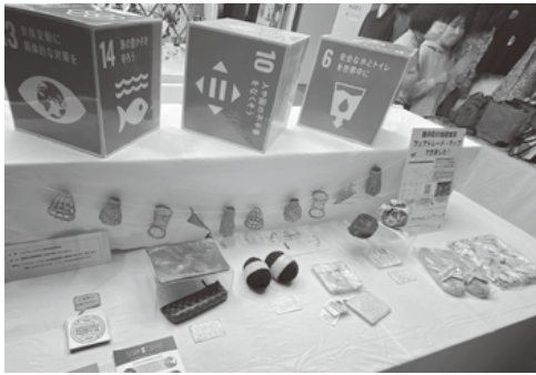
フェアトレード巡回展

今後一人ひとりの行動変容が重要なSDGsの取り組みを地域の中で進め、人・モノ・エネルギーを自給する循環型社会の構築を目指して活動していきます。