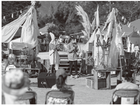
フェアトレードデイ垂井