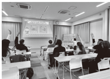
Desafio do quiz sobre reciclagem

pellets (pequenos grãos de resina), uniformes de trabalho, novas garrafas PET