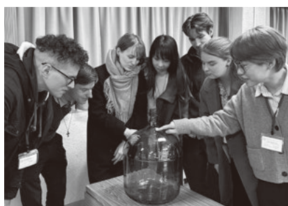
Frasco resistente a ácidos, fabricado para armazenar produtos químicos (Fabricado há mais de 40 anos atrás)