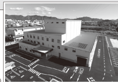
Centro de Reciclagem de Gifu (Cidade de Gifu)

O Centro de Reciclagem é responsável por processar quatro categorias de lixo reciclável recolhido das casas: latas, embalagens plásticas, vidros e garrafas PET. Após um processo manual de triagem rigoroso, cada material passa por um processo específico, como armazenamento e compactação, e então são enviados para fábricas de reciclagem onde serão reaproveitados.