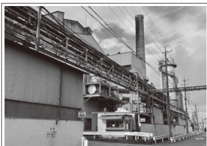
Nihon Taisanbin Kogyo Co., Ltd. (Cidade de Ogaki)