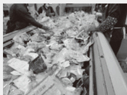
Processo de triagem manual de embalagens plásticas

Os funcionários realizam a triagem manual, removendo materiais muito sujos, inadequados ou contaminados.