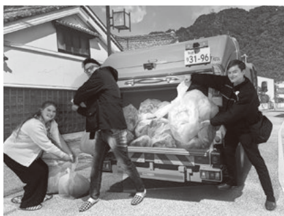
Chegando bem perto do caminhão de lixo! (Ilusão de arte)