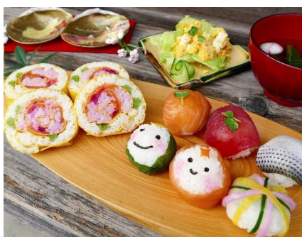
Mitake Hanazushi e Temarizushi

É um programa turístico da província de Gifu para caminhar se divertindo ao passar pelas 17 cidades estações e percorrer os 126,5