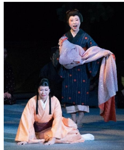
Imagens do ano passado

A Fundação para Educação e Cultura de Gifu vem realizando uma ópera original que aborda como tema a história e a cultura de diversas regiões desta província. Este ano, celebra-se 20 anos desde o primeiro espetáculo e haverá a reprise das obras "Tsubakiyashiki", "Kitsune no Yomeiri" e "Nishi Shinobiike" que foram as mais solicitadas pelo público para esta apresentação especial de celebração.