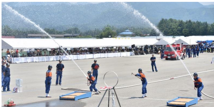
Imagens do Campeonato de Habilidade dos Bombeiros da Província 2019

Os membros do shobodan são trabalhadores assalariados, autônomos, estudantes e inclusive donas de casa. Qualquer pessoa com mais de 18 anos pode se tornar um membro. Que tal se tornar um membro do shobodan em prol da sua comunidade?