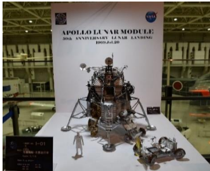
Módulo Lunar Apollo (maquete escala 1/15) (Obra vencedora do Concurso Nacional de Maquete de Satélite Artificial e Robô Lunar)

50 anos da chegada do homem à Lua. Esta exposição apresenta os atuais programas espaciais, tais como o “Gateway” previsto para ser desenvolvido como uma estação espacial em órbita lunar, o robô lunar tripulado, os programas espaciais de empresas privadas, entre outros.