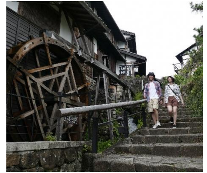
Nakasendo – Magomejuku

É o evento mais simbólico de Nakasendo que tem como palco o caminho Nakasendo que passa pela província e as 17 estações. Aproveite os passeios atraentes