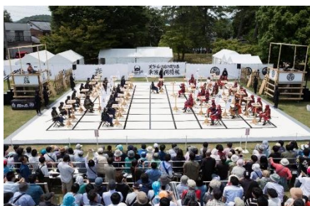
"Tozai Ningen Shogi" Sekigahara – Campo da divisão de poderes

Será realizado um evento com foco na Batalha de Sekigahara e no confronto leste e oeste. O evento contará com o "Tozai Ningen