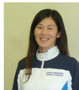
(acima) Rie Kaneto , embaixadora do torneio (esquerda) Imagens da aula de beisebol

Em setembro será realizado pela primeira vez em Gifu, o evento esportivo "Sports Masters Japan" que reunirá atletas com mais de 35 anos. Este será um evento comemorativo dos 100 dias para a realização do evento e haverá aulas experimentais de esportes ministrados por Rie Kaneto,