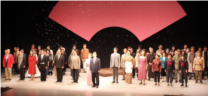
Espetáculo do ano passado

“Chiune Sugihara”, o Schindler do Japão, que através da emissão do visto de trânsito, salvou a vida de 6.000 judeus: “Não podia ver morrer as milhares de pessoas que me procuravam”. Os descendentes dos judeus que ele salvou hoje são mais de 10 mil e há sentimentos de gratidão por todo o mundo. Aprecie esta ópera que reproduz essa emocionante história real.