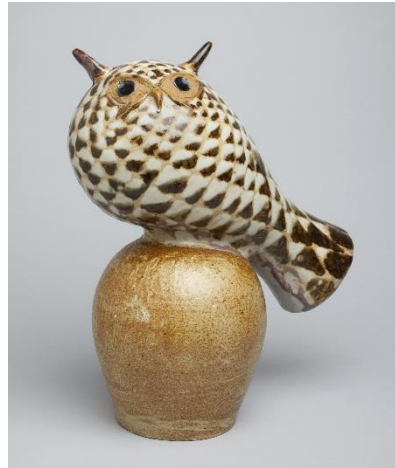
Michael Schilkin <Escultura (Coruja)> Anos de 1950 Cerâmicas Arabia Coleção de Kakkonen ©KUVASTO, Helsinki & JASPAR, Tokyo, 2018 C2428

A autêntica cerâmica da Finlândia surgiu em um contexto em que havia forte tendência pela independência da Rússia no final do século 19. Ela se desenvolveu ao ponto de criar uma tendência mundial em meados do século 20. Essa exposição mostrará o fascínio da cerâmica finlandesa através das peças produzidas desde o