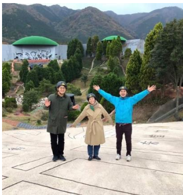
Nadeyata Instant Party