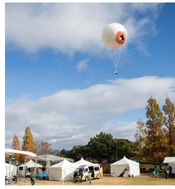
Yoro Art Picnic (imagens de 2017)