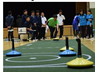
Imagens do “Festival Recreativo Gifu Seiryu 2017” (esquerda: Cerimônia de Abertura, direita: Unicurl)

Será realizado o “Festival Recreativo Gifu Seiryu”, um evento que promove a interação de qualquer morador desta província (de crianças a idosos, deficientes físicos ou não) com a recreação. A cerimônia de abertura será realizada no dia 29 de setembro (sáb) no Gifu Memorial Center. Os torneios e os eventos em parceria com os municípios serão realizados em diversas partes desta província, especialmente entre setembro e outubro. Alguns eventos serão livres para a participação no dia e por qualquer pessoa, portanto, participem!