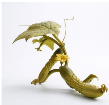
【Escultura de marfim】Pepinos, Rokuzan Ando Era Meiji - Taisho

A arte da Era Meiji tem sido destaque nos últimos anos. Nesta exposição, haverá apresentação de peças minunciosas que encantam os apreciadores do Meiji Kogeï e de peças de artistas modernos que seguem este espírito. Venha apreciar a cena em que as artes, antigas e modernas, tais como as esculturas de marfim, jizai , cerâmicas, lacas, kinko (arte com metal), se encontram frente a frente além do espaço e tempo.