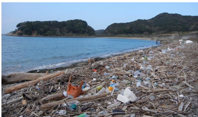
Lixo plástico espalhado na praia

Parte do lixo plástico produzido nesta província é transportado pelo rio até o mar, tornando-se uma das causas da poluição marinha. 70% dos lixos que chegam no mar é lixo plástico e a metade disso são embalagens plásticas descartáveis de alimentos. Esta província está desenvolvendo projetos voltados para a redução do uso de embalagens plásticas descartáveis para reduzir o lixo plástico.