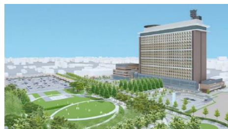
Imagem externa do novo prédio do governo