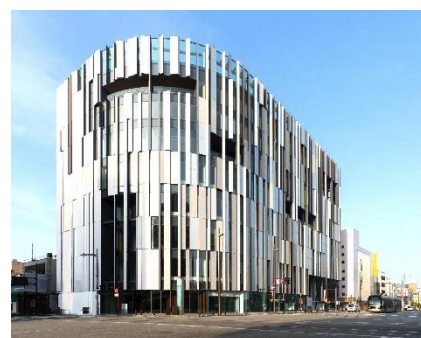
Fachada do Museu de Artes em Vidro de Toyama-shi

Em comemoração ao dia 5 de julho, "Dia do intercâmbio Toyama-Gifu", será realizado um passeio de ônibus de 1 dia para apreciar os atrativos da província de