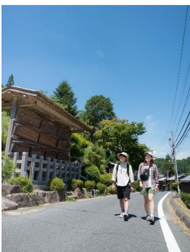
Caminhada pelas cidades estações

É um programa "Caminhar se divertindo em um passeio por Gifu" realizado nos 126,5km da rota Nakasendo que passa pela província e nas 17 cidades estações. Os participantes poderão experimentar algumas atividades exclusivas da época do verão em Nakasendo, como a caminhada pelas cidades estações, etc.