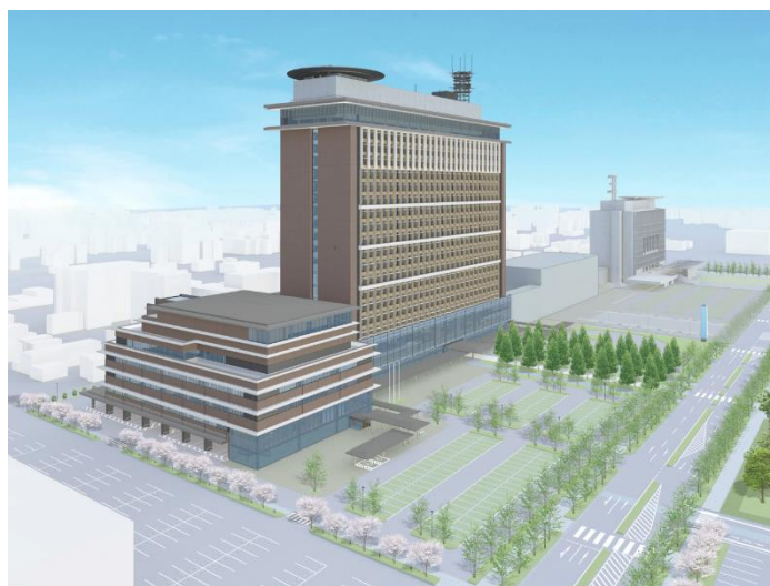
Ilustração externa do novo prédio

[Locais para acesso ao manual do projeto executivo]