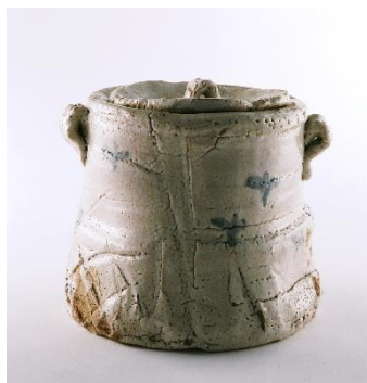
Toyozo Arakawa 《Shino Mizusashi》 Ano 1938-41 Acervo do Museu de Arte Cerâmica Moderna de Gifu

É uma exposição que apresenta a história da arte cerâmica moderna de Mino, com foco no movimento renascentista a partir dos anos iniciais da Era Showa. Veja a história da arte cerâmica de Mino desenvolvida pelos artistas cerâmicos, com muito respeito à tradição.