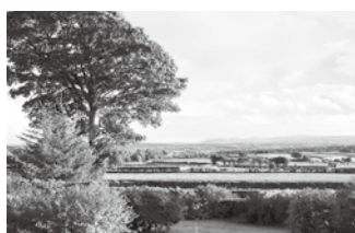
Vista da casa dos meus pais

Antes de vir para Gifu, eu morava na Irlanda do Norte, onde a população total corresponde a apenas 3% da população do Reino Unido. A Irlanda do Norte localiza-se ao norte da Ilha da Irlanda e faz divisa ao sul e ao oeste com a Irlanda, porém, quando houve a divisão norte e sul da Irlanda em 1921, ela ficou com o Reino Unido. Por esse motivo, possui uma cultura mista própria contendo a tradição do Reino Unido e da Irlanda. Eu morava em uma pequena vila perto de Belfast, a capital da Irlanda do Norte. O meu vizinho é agricultor e cultiva batata, trigo e cria gado e ovelhas. O filho dele adora a agricultura e desde os 13 anos, ajuda os pais dirigindo um trator grande. Como a Irlanda do Norte é um país pequeno, dizem que quando 2 norte-irlandeses se encontram, sempre descobrem amigos ou parentes em comum. Eu mesma, quando encontrei por acaso um norte-irlandês em Tokyo, descobri que tínhamos um conhecido em comum. A Irlanda do Norte possui praias e fazendas bonitas e o turismo se popularizou nos últimos anos. Fica um pouco distante do Japão, mas se houver uma oportunidade, visite a Irlanda do Norte.