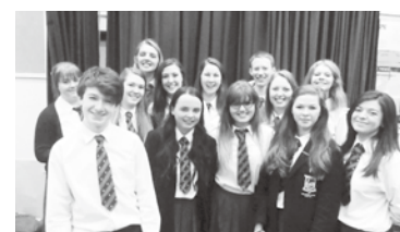
A vida escolar no ensino médio da Irlanda do Norte