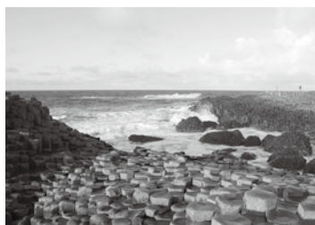
Calçada dos Gigantes (Giant's Causeway)

Antes de vir para Gifu, eu morava na Irlanda do Norte, onde a população total corresponde a apenas 3% da população do Reino Unido. A Irlanda do Norte localiza-se ao norte da Ilha da Irlanda e faz divisa ao sul e ao oeste com a Irlanda, porém, quando houve a divisão norte e sul da Irlanda em 1921, ela ficou com o Reino Unido. Por esse motivo, possui uma cultura mista própria contendo a tradição do Reino Unido e da Irlanda. Eu morava em uma pequena vila perto de Belfast, a capital da Irlanda do Norte. O meu vizinho é agricultor e cultiva batata, trigo e cria gado e ovelhas. O filho dele adora a agricultura e desde os 13 anos, ajuda os pais dirigindo um trator grande. Como a Irlanda do Norte é um país pequeno, dizem que quando 2 norte-irlandeses se encontram, sempre descobrem amigos ou parentes em comum. Eu mesma, quando encontrei por acaso um norte-irlandês em Tokyo, descobri que tínhamos um conhecido em comum. A Irlanda do Norte possui praias e fazendas bonitas e o turismo se popularizou nos últimos anos. Fica um pouco distante do Japão, mas se houver uma oportunidade, visite a Irlanda do Norte.