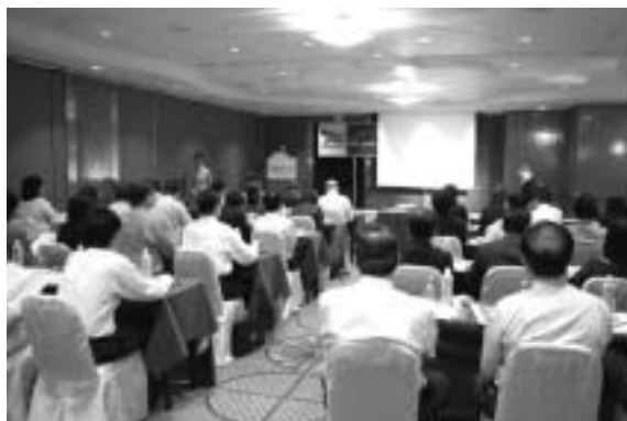
Reunião em Singapura