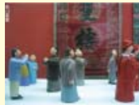
Recepção de casamento antigo chinês

Conclurmos que em relação a cor e cerimônias formais assim que chineses e japoneses têm muitos pontos em comum mas também têm muitos pontos divergentes.