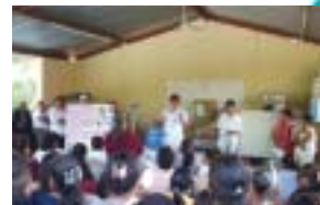
Reunião explicativa da “Caderneta de autocuidados do paciente com diabetes” Ando está a esquerda na foto.

JICA - Sucursal Gifu - Kenmin Fureai Plaza, 6F, dentro do Centro Internacional de Gifu