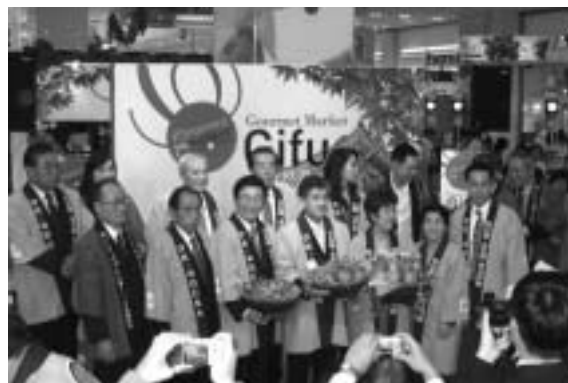
Divulgação e venda de produtos agrícolas na Tailândia