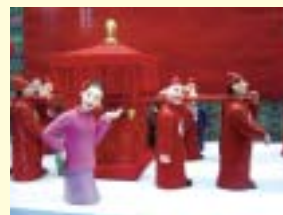
A chegada da noiva em casamento antigo chinês