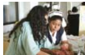
Após a orientação do banho seus colegas de trabalho começaram a orientar as famílias

Depois do seu retorno ao Japão a ex-voluntária pensa em ser uma enfermeira comunitária e para isso irá voltar a estudar a partir da próxima primavera. Estamos todos aqui torcendo pelo seu sucesso!