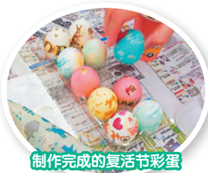
制作完成的复活节彩蛋