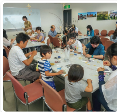
制作完成的苏达斯