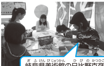
岐阜県美術館のひびのかつこ館長もしおりを作ったよ!