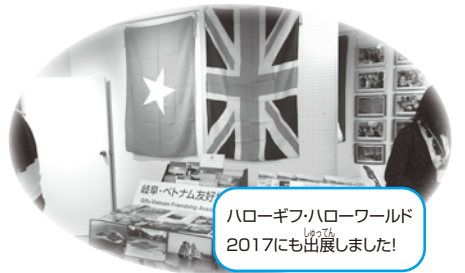
ハローギフ・ハローワールド 2017にも出展しました!