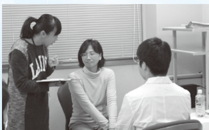
じっしゅう ロールプレイ実習