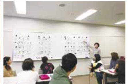
防災ワークショップ