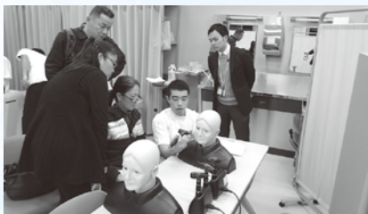
びやういん じっしゅう バーチャル病院の実習

当センターでは、日本語が不自由な外国人の方が安心して医療機関を受診することができるよう、県内の医療機関からの依頼に応じて医療通訳ボランティア(ポルトガル語、中国語及びタガログ語)を斡旋する「岐阜県医療通訳ボランティア斡旋事業」を運営しています。この事業の医療通訳ボランティアのスキルアップと、新たな通訳者の発掘及び育成のため、「医療通訳ボランティア研修」を実施しました。