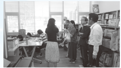
しえんまじゅう 支援教室の見学