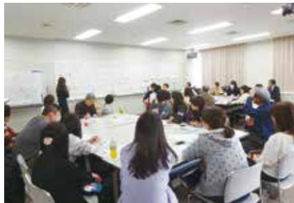
災害時外国人支援ボランティア研修

防災ワークショップは多文化演劇ユニットMICHUさんにご協力いただきました。体を動かしたり、カードを使ったゲームを行うなどして自分の身を守るためにとるべき行動や必要な日本語、助けてほしいときに使う言葉を知っていただき、楽しく防災について学ぶことができました。