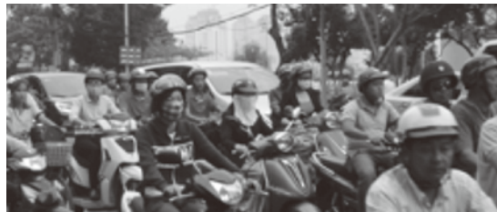
写真：ホーチミン市内(2016年2月)