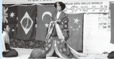
十二単の着付けショーでは、衣装の美しさ、着付けの手際の良さに見入ってしまいました。