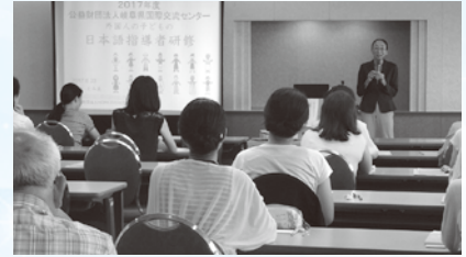
こうぎようす 講義の様子

そこで、当センターでは日本語教室の指導者の方等を対象とした、「外国人の子ども」の日本語指導者研修を行い、地域における日本語支援の担い手を育成しました。