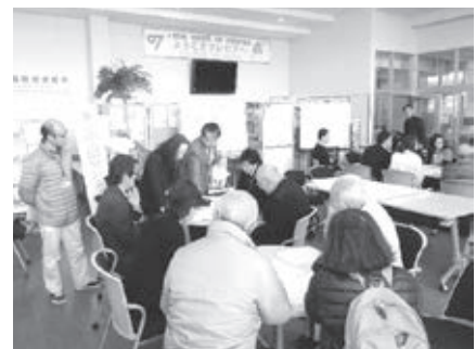
多言語支援センター設置運営訓練では、総務班と情報班に分かれ、班別に訓練を実施

可児市国際交流協会の協力を得て、平成27年2月15日（日）、可児市多文化共生センターフレビアで、「災害時語学ボランティア研修」を開催しました。実際に地震災害が起きたと想定し、多言語支援センターをフレビア内に立ち上げ、研修参加者は、外国人が避難している避難所の確認や状況把握、巡回ルートの検討等を行う総務班と、災害情報の切り分けや必要情報の翻訳を行う情報班の2つの班に分かれ、訓練を行いました。避難所巡回訓練では、研修参加者がグループごとに、被災者役の外国人住民に、情報を伝えたり、聞き取り調査を行ったりして避難所で困っていることや外国籍住民の人数等を把握、新しい情報の収集をしました。研修では、非常食体験や外国人住民を対象とした防災体験セミナーも開催しました。同セミナーでは、外国人住民が災害発生時に自分の身を守る方法、非常持出袋や避難所に持って行くもの等についてワークショップ形式で体験し、災害に関する知識を持ち、事前に準備をすることの大切さについて学びました。 ※「災害時語学ボランティア」の開催及び参加者募集については、決まり次第、ホームページ等でお知らせします。