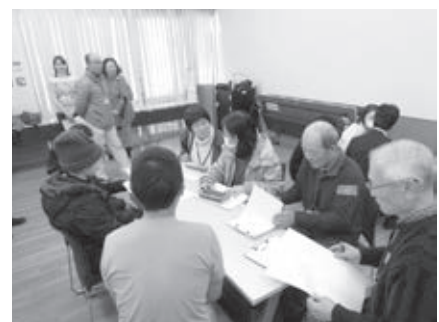
避難所巡回訓練で、研修参加者が被災者役の外国人住民に聞き取りを行っている様子