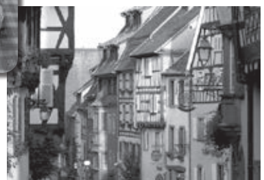
▼木骨組みの建物が続くリクヴィルの町並み