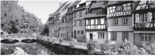
オ＝ラン県コルマルの町並み