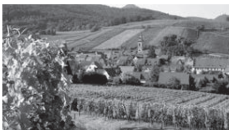
ブドウ畑に囲まれたアルザスの村