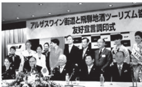
飛騨の地酒とアルザスワインの交流がスタート

また同時期には、高山市がコルマルと経済・観光分野に関する「協力協定」を締結し、白川村が「フランスで最も美しい村」に認定されているリクヴィルと「友好協力推進宣言」に署名しており、今後、幅広い分野で市民交流の広がりが期待されます。