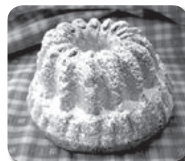
▲アルザス地方の焼き菓子クグロフ

岐阜県、高山市、白川村との提携を契機に、オ＝ラン県の皆さんとの交流が広がり、岐阜県内でもアルザスの文化やグルメに触れる機会が増えてくるかもしれません。