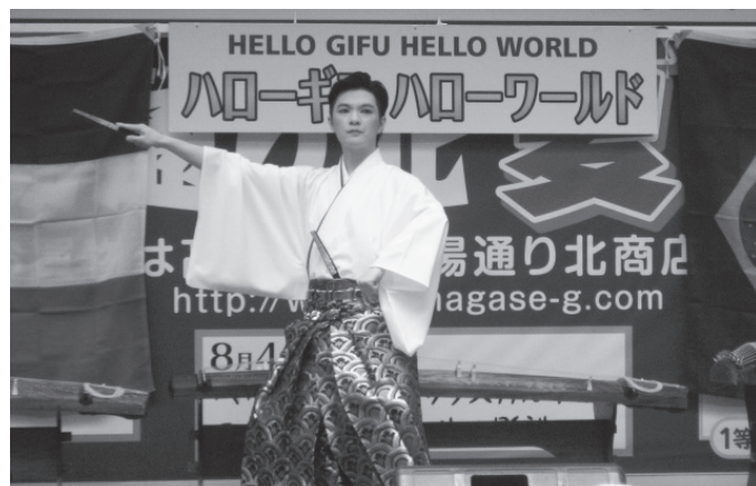
▲日本舞踊のステージ