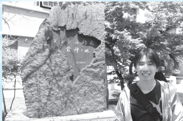
海外移住と文化の交流センター前(神戸市、2013年4月)

サンパウロ大学工学部機械工学を卒業後、一旦就職されましたが、製造業における物流の知識をもっと深めたい気持ちがありました。岐阜大学で同分野の研究が行われていることを知って、県費留学生制度に応募しようと思われたそうです。