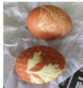
たまねぎの皮の煮汁で染めたイースターエッグ

現在、イギリスでイースターエッグと言えばチョコエッグになりました。チョコエッグ交換や宝探しといった子供が楽しむイベントが多く見られます。リトアニアでは生卵を使ってイースターエッグを作る習慣があります。生卵に葉っぱをはって、玉ねぎの皮を入れたお湯で茹でます。そうすると葉っぱを貼った部分が染まらず模様ができます。そのほかに、ゆで卵に蜜蝋で模様を描き、染液に入れて染める方法もあります。皆さんもチャレンジしてみませんか。