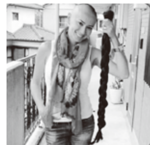
寄付するために髪を切ったエロイゼさん