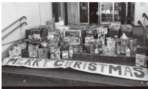
こんなに支援物資が集まりました